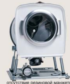
отсутствие резиновой манжеты