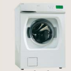
отжим без вибрации